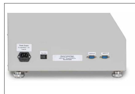
Interfaz para la transmisión de datos del instrumento de medición SAUTER FH y para controlar el banco de pruebas con el software SAUTER AFH