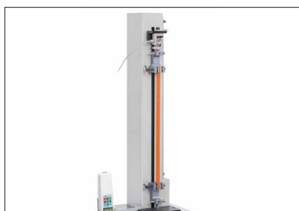
Diversas posibilidades de empleo gracias a un gran recorrido