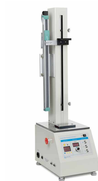
Motorisierter Prüfstand inkl. Längenmesssystem LD