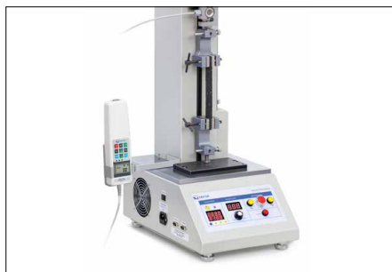
Posibilidades de fijación sólidas y flexibles de muchas abrazaderas y piezas de accesorios de la gama SAUTER, véase en Accesorios