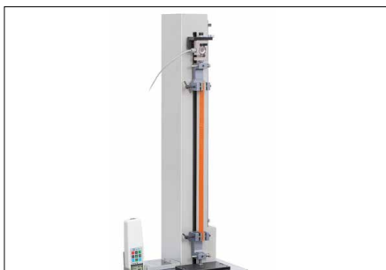
Diversas posibilidades de empleo gracias a un gran recorrido