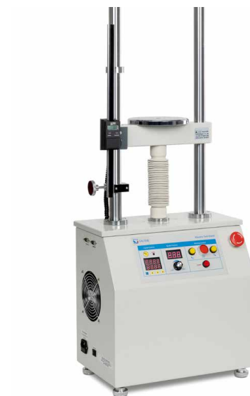
Banc d'essai motorisé incl. dispositif de mesure de longueur LB