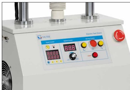
Tableau de commande haute gamme - affichage de vitesse numérique - fonction répétition numérique