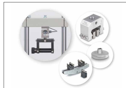
Possibilités de fixation solides et flexibles de nombreux accessoires et pinces de la gamme SAUTER, voir Accessoires