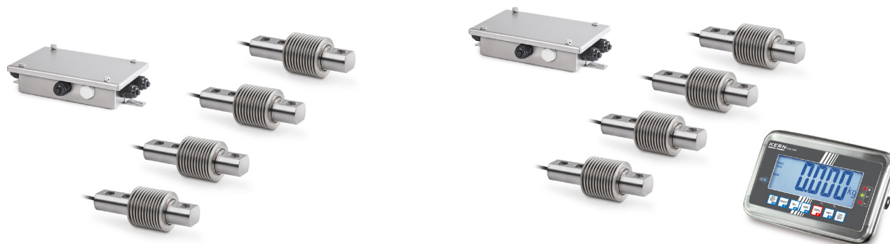
SAUTER CW RB