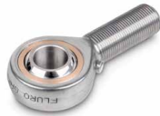
Fig. mostra accessorio opzionale 1 SAUTER CE R20, altri accessori sono disponibili nel webshop