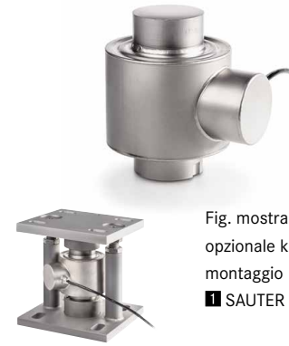
Fig. mostra accessorio opzionale kit di montaggio SAUTER CE P41430