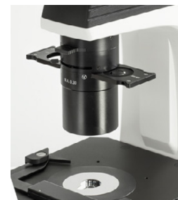
Abbe O.N. 0,3 avec diaphragme d'ouverture