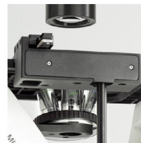
Les boutons coaxiaux de réglage des x/y peuvent être installées à droite ou à gauche