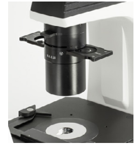
N.A. 0,3 Abbe Kondensator mit Phasenkontrastschieber