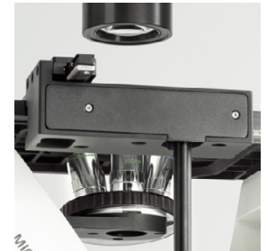
Koaxiale Triebknöpfe für x/y Anbringung links oder rechts möglich