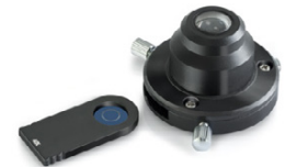
Condensador sencillo de contraste de fases con corredera PH de 40x