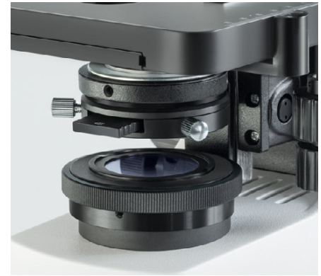
Condensador de contraste de fases