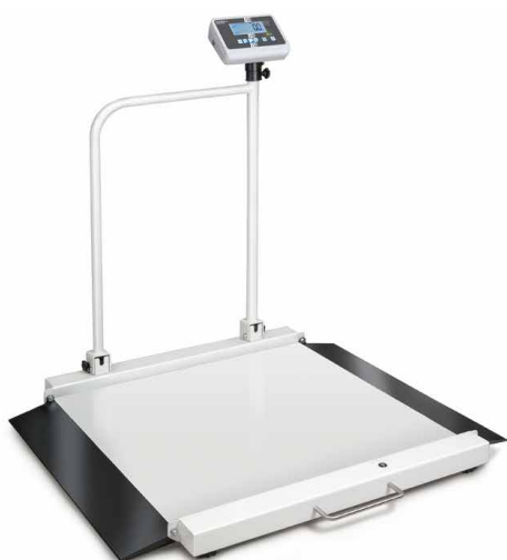
KERN MWA 300K-1PM

Bilancia per sedie a rotelle con due rampe integrate per una comoda salita – con autorizzazione all'uso medico, per l'uso professionale nella diagnostica medica, omologazione opzionale