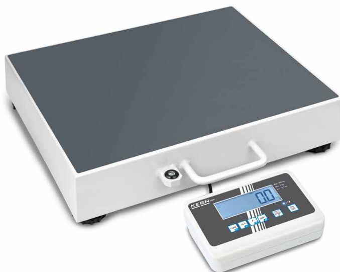
KERN MPC 300K-1LM