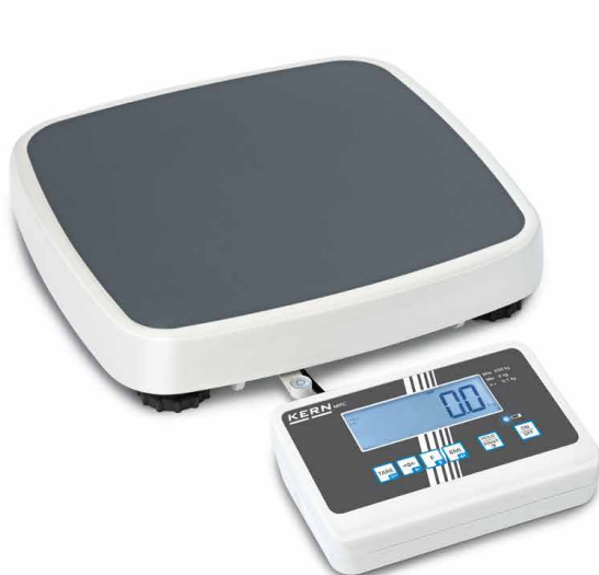
KERN MPC 250K100M

Bilancia pesapersone compatta con autorizzazione all'uso medico, per l'uso professionale nella diagnostica medica, omologazione opzionale