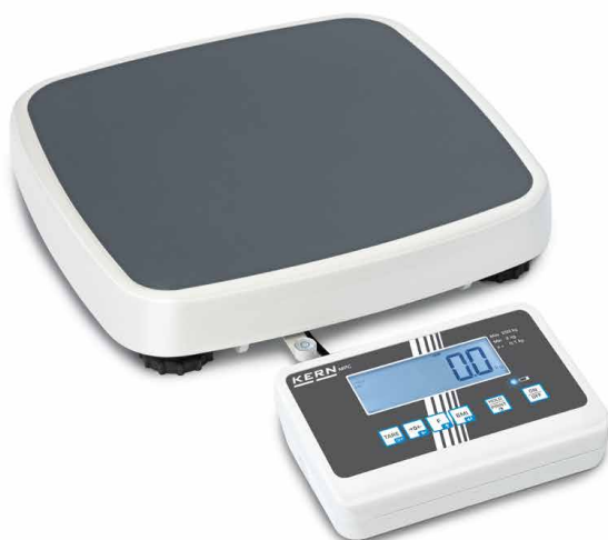
KERN MPC 250K100M

Pèse-personne compact avec approbation médicale pour une utilisation professionnelle dans le diagnostic médical, homologation en option